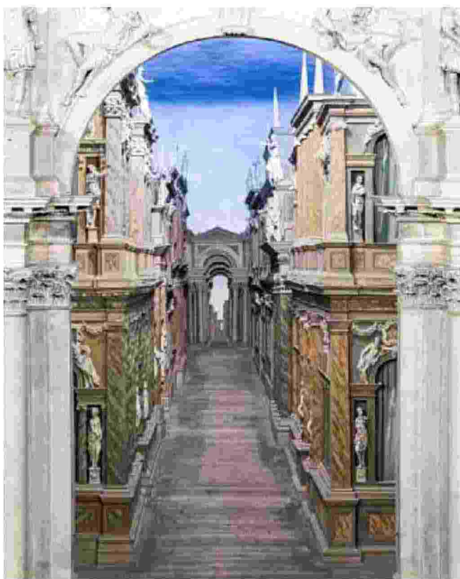
Molti gli scatti di monumenti berici: nell'immagine, il teatro Olimpico