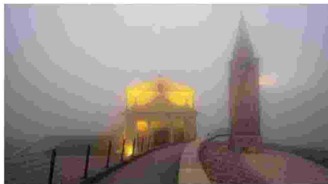
Il santuario della Madonna dell'Angelo di Caorle in un altro scatto