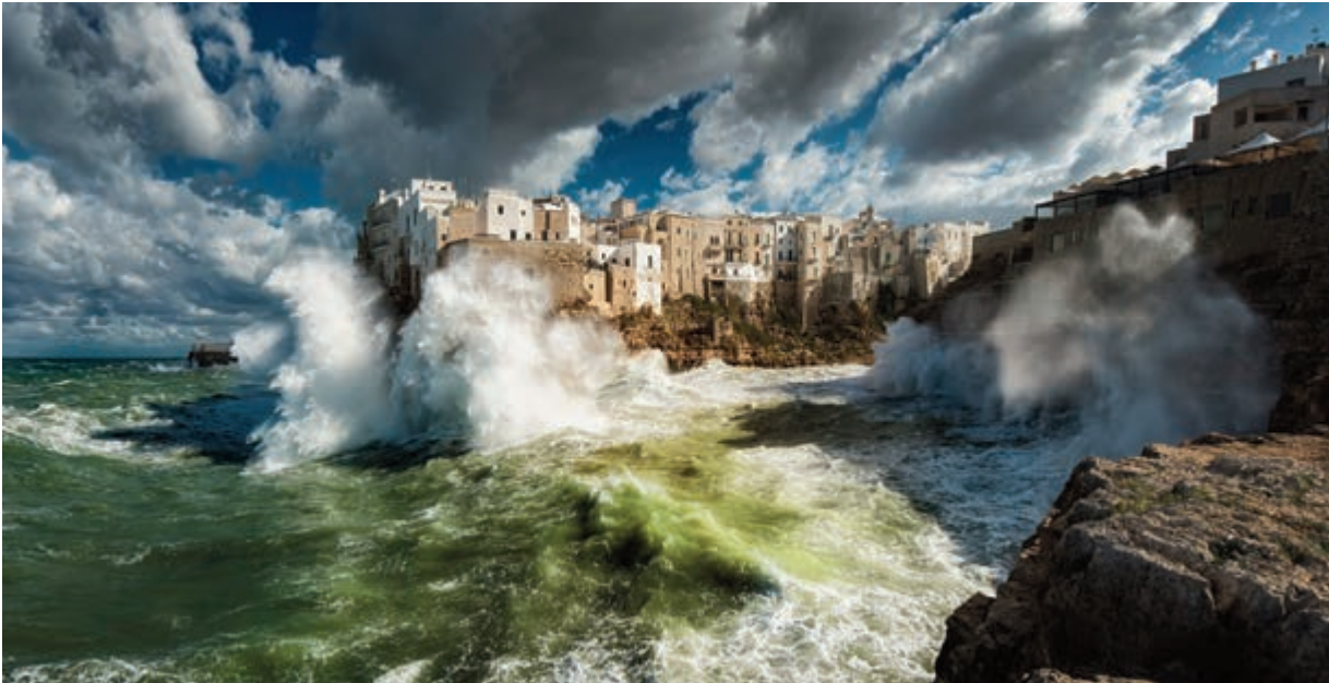
Mareggiata a Polignano di Nicola Abbrescia (primo classificato)

Il ventiduesimo appuntamento con la Pagina Bellezza del Qds è dedicato al patrimonio storico, culturale e paesaggistico dell'Italia. Le bellezze del nostro Paese sono raccontate, da Nord a Sud, negli scatti dell'edizione italiana dell'ormai celebre concorso fotografico Wiki Loves Monuments, il più grande concorso fotografico del mondo che coinvolge oltre 50 Stati raccogliendo immagini di monumenti per documentare il patrimonio storico e culturale di ogni nazione e illustrare le pagine di Wikipedia.