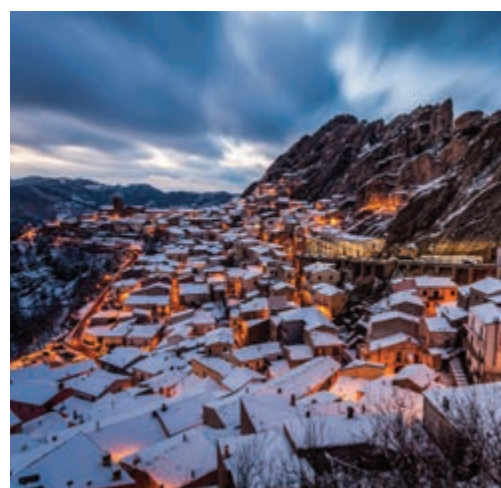
Pietrapertosa di Teodoro Corbo