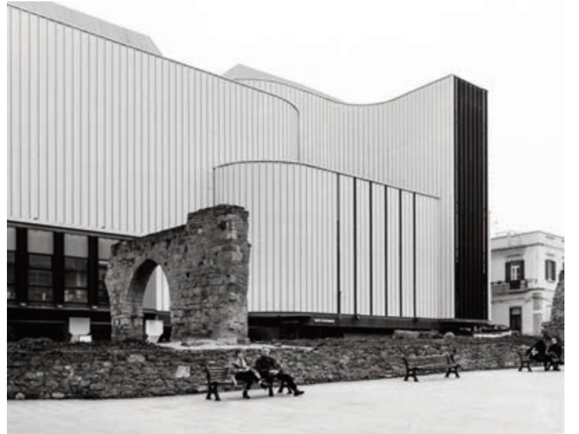
Il teatro Verdi di Brindisi di Gabriele Costetti (secondo classificato)

QdS, l'informazione che racconta la Bellezza