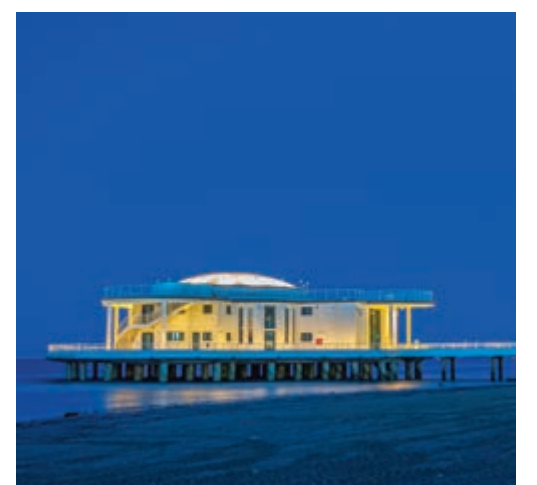
La Rotonda di Senigallia di Perpaolo40