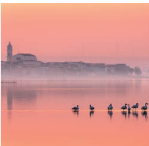
I fenicotteri di Lesina di Alberto Busini