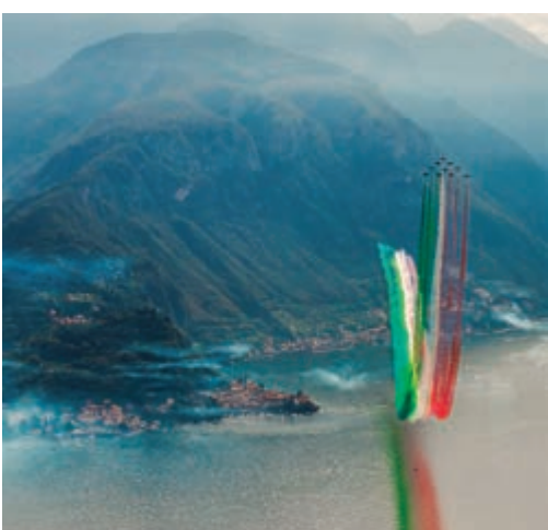
Le Frecce tricolori a Varenna di Achille Ballerini