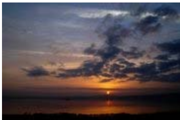
Il Lago di Bolsena al tramonto