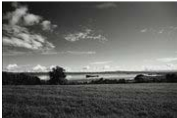
Il Lago di Bolsena (ripresa grandangolare)