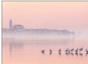
Sopra i fenicotteri sul lago di Lesina Sotto la mareggiata di Polignano

Nello scorso mese si era svolto il concorso di Wiki Loves Monuments su base regionale. In Basilicata lo scatto più votato fu sempre di Teodoro Corbo che immortalò il panorama di San Fele.