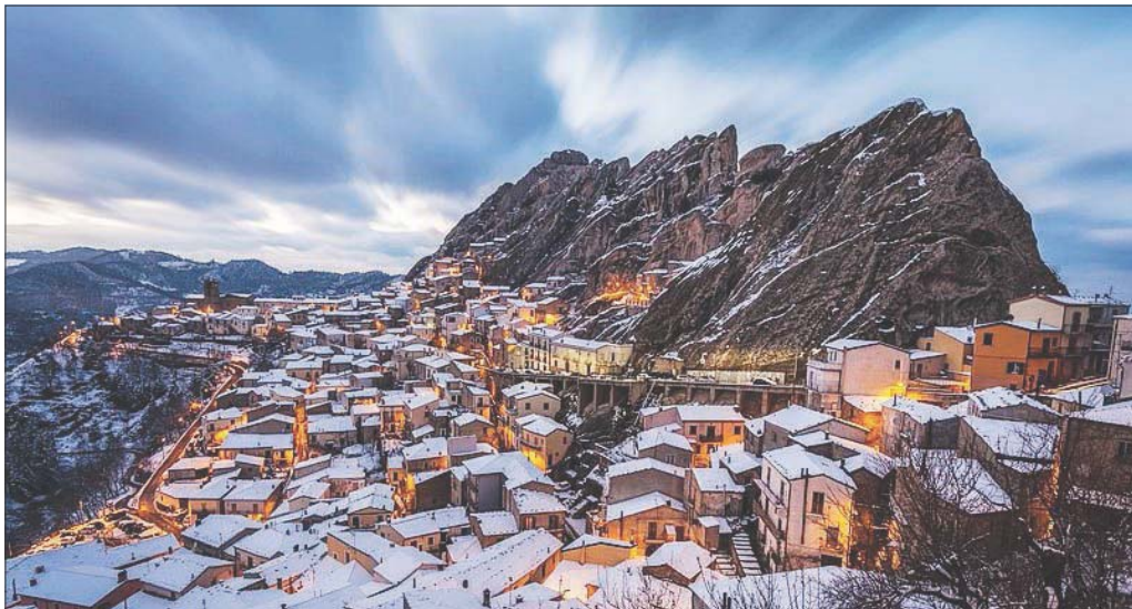
Il paesaggio innevato di Pietrapertosa immortalato da Teodoro Corbo che ha ottenuto il quinto posto nel concorso Wiki Monuments Loves

Lo scorso mese di San Fele ha vinto la selezione su base regionale