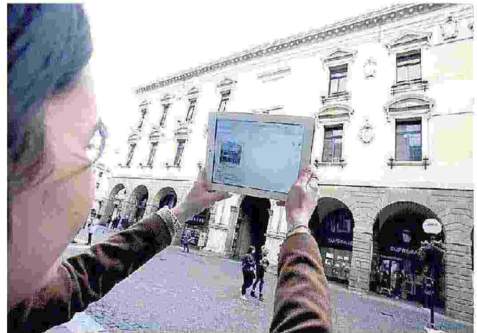
Il palazzo del Bo è uno dei siti che distinguono Padova

» Il Mapping Party inizierà alle 9.30: bisogna presentarsi con smartphone o tablet. È tutto gratuito